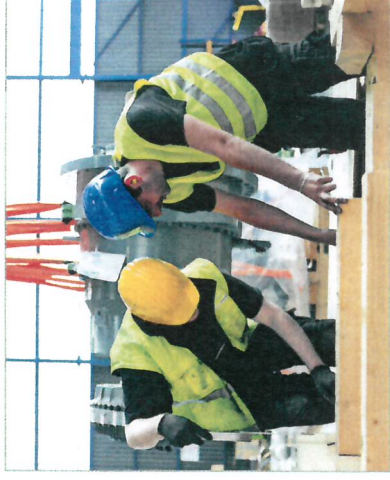
Maßgenaue Fertigung einer Schwergutverpackung

Der HPE-Betrieb, der die oben genannten Qualitätsmerkmale erfüllt, wird in die Fachgruppe „Verpackung nach HPE-Standard“ aufgenommen. Derzeit dürfen 69 Unternehmen mit „Verpackung nach HPE-Standard“ und dem Fachgruppenlogo „HPE-certified custom packaging“ werben. Einer davon ist sicher auch in Ihrer Nähe. Sie finden die zertifizierten Verpacker unter www.hpe-standard.com .